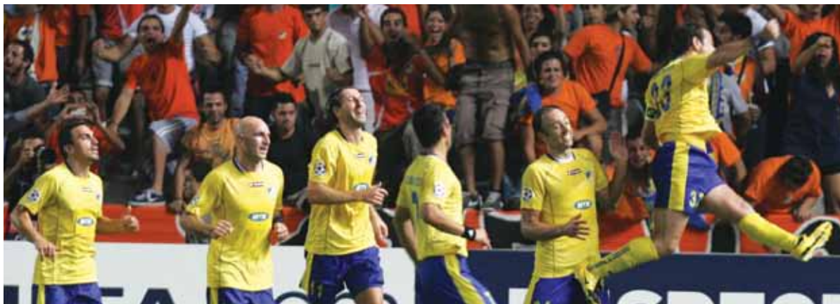
Ποδοσφαιριστές και φίλοι του ΑΠΟΕΛ πανηγυρίζουν την ιστορική πρόκριση της ομάδας τους στους ομίλους του Champions League, εναντίον της Κοπεγχάγης στις 26 Αυγούστου.