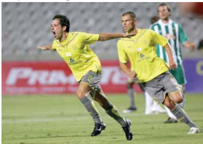
Από τον αγώνα του ΑΠΟΠ Κινύρας με την Ραπίντ Βιέννης στις 6 Αυγούστου στο ΓΣΠ.