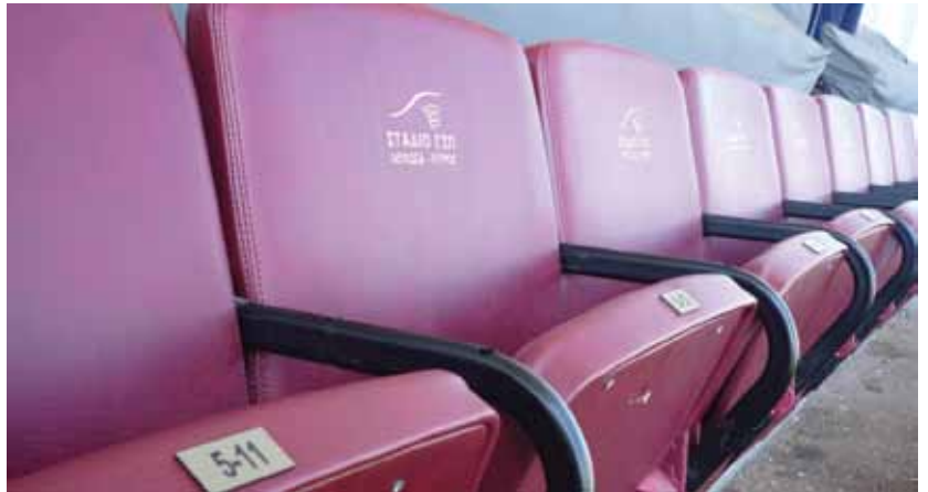
Έχουν αντικατασταθεί και αυξηθεί τα καθίσματα του χώρου των επισήμων και έχει τοποθετηθεί καινούριο αντιολισθητικό πάτωμα.

Παρακαλούνται τα μέλη όπως επικοινωνήσουν με τα γραφεία του Συλλόγου (στο τηλέφωνο 22874050) τόσο για πληροφορίες για τα πιο πάνω αλλά και για επαλήθευση και συμπλήρωση των στοιχείων τους για καλύτερη επικοινωνία.